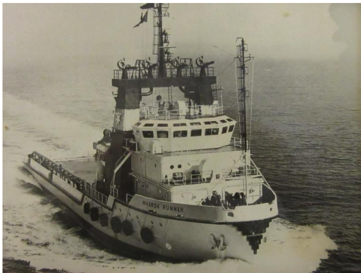
Mærsk Runner med skum for boven

Alt det skete i en weekend, og søndag kl. 20.00 blev skibet fortøjet igen ved værftets udrustningskaj. Flyet blev landsat og rullet ind i en stor udrustningshal. Nogle vittige sjæle har efterfølgende hejst flyet op under taget i hallen, således fandt de første værftsansatte, der mødte mandag morgen en stor vandpyt. Stor var deres forbavselse, da de kiggede op og så en flyvemaskine hænge under taget. Flyet blev stående på værftet i rum tid og blev senere foræret til et flymuseum på grund af kolossale inspektionskrav fra luftfartsvæsenet, da det jo havde været i saltvand.