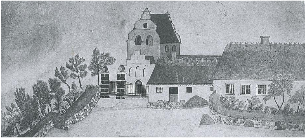
Den eneste kendte afbildning af hospitalet fra 1734 er en tegning fra 1820. Både bygningen, og Munkebos første skole foran det, gik til ved storbranden i 1842. Et nyt blev bygget, muligvis i kommunens regi.

Fra 1800-tallet begyndte befolkningstallet at stige på landet. Det er der rigtigt mange forklaringer på, først og fremmest et fald i dødeligheden. Ved århundredeskiftet udgjorde befolkningen i Munkebo sogn omkring 500, men ved den næste tælling i 1834 var tallet 791, og det steg støt op gennem århundredet. Antallet af selvstændige beboelsesenheder kunne dog langt fra følge med, så adgangen til et rimeligt stykke jord var mere end vanskelig for mange. Konsekvensen var flere potentielt fattige indbyggere. Mange af disse kunne ganske vist opretholde livet med lidt hjemmehåndværk, dagleje og fiskeri, men fattigdomsproblemet og hjælpebehovet bestod. Det er nemlig anslået, at omkring halvdelen af Danmarks befolkning i 1800-tallet levede på fattigdomsgrænsen, og at 6-8 procent havde brug for lejlighedsvis fattighjælp, der principielt skulle betales tilbage. Munkebo har muligvis haft en skæv befolkningsfordeling med et uforholdsmæssigt stort antal indbyggere, som i perioder var stærkt afhængige af fattighjælp.