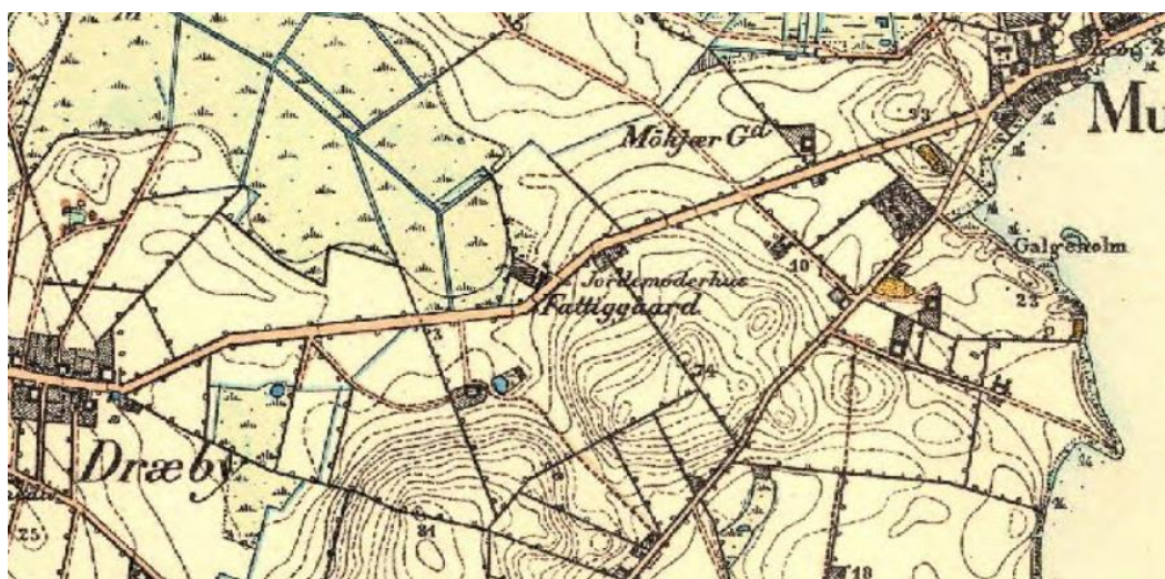
Den gamle Odense landevejs forløb gennem Munkebo og Dræby (nu Fjordvej, Dræbyvej og Stationsvej). Fattiggården lå, som det ses, ved landevejens "knæk".

Året 1842 blev det egentlige startskud til lokalt selvstyre, idet der oprettedes sog-neforstanderskaber (fra 1867 benævnt sogneråd), og sognene blev til kommuner. Præsten og den lokale godsejer var til 1867 fødte medlemmer, mens de øvrige forstandere var 4-5 personer, valgt af de største skatteydere, som udgjordes af gårdmændene. Sogneforstanderskaberne overtog både styrelsen af fattig-forsorgen og den lokale skole, som havde fungeret siden 1807.