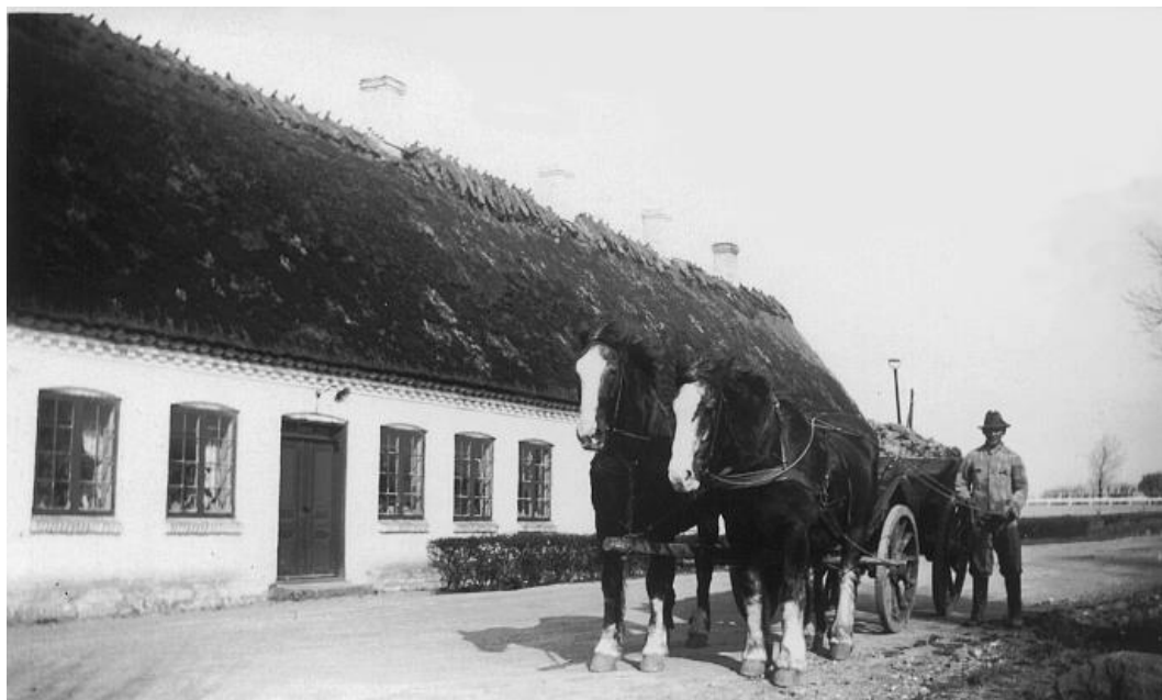
Fattiggården o. 1940. I baggrunden ses autoværnet ved den nye vejføring