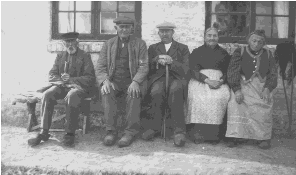
Fattiglemmer og aldersrentenydere slikker sol foran Fattiggården (1925-1930)

Skolen, nu fattiggården, var et kompleks af bygninger, alle grundmurede med stråtag. Hovedbygningen ud mod landevejen rummede efter de nødvendige ændringer 10 værelser langs en lang korridor. Der var 2 køkkener og 2 spisekamre. Den var også bolig for skiftende bestyrere — formodentligt i den vestlige ende — og det fremgår af sognerådets protokol fra 1928, at det også rummede en ”sognerådssal”. En af de tre mindre bygninger var lade og brugtes også til vaskehus, brændehus, svinesti, kostald og latriner. En anden var