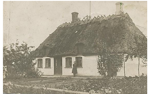
Hørsvingerhuset i Dræby