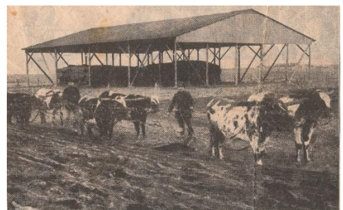
Eksempel på en stakhjelm