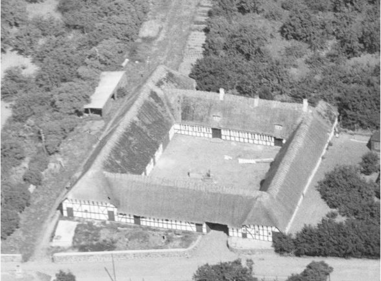
Elkærgaard, fotograferet i 1948