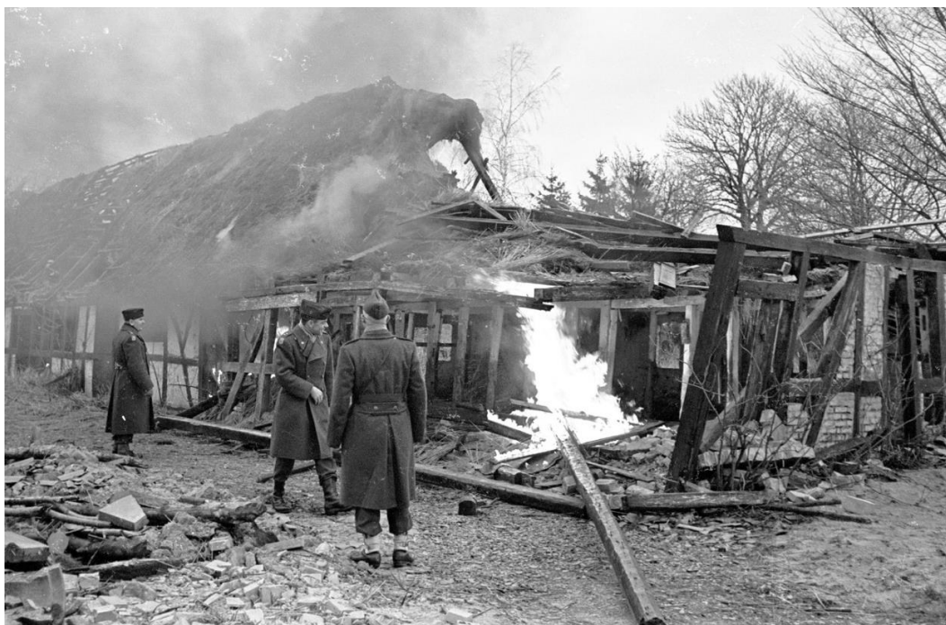
Som øvelse nedbrænder Civilforsvaret Lindøgaard 22. januar 1965.

Myndighederne var bange for, hvad de unge mennesker i Munkebo mon lavede på Lindøgaard. Det blev derfor besluttet at brænde gården af ved en sluknings- og redningsøvelse 22. januar 1965, hvori Civilforsvaret fra Sandholtlejren deltog. Så var det slut med det ungdomshus.