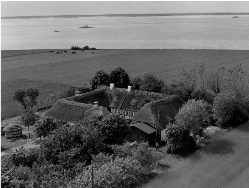
Lindøstedet ca. 1956 - øens eneste gård.

Tiderne skiftede i 1913, hvor Carl Th. Zahle blev konceilspræsident (statsminister) i den første Radikale regering. Netop det radikale Venstre havde tætte bånd til husmandsbevægelsen og der blev sat