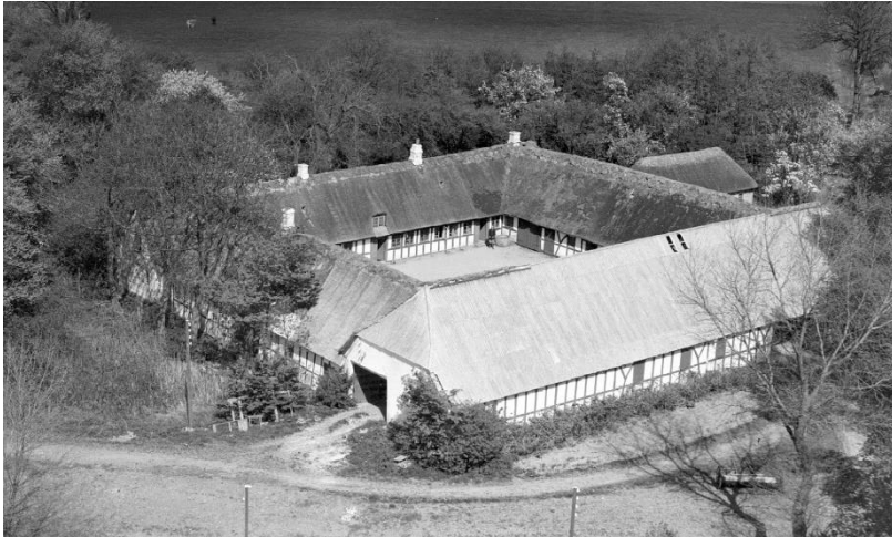
Luftfoto af den store firlængede Lindøgaard ca. 1952.