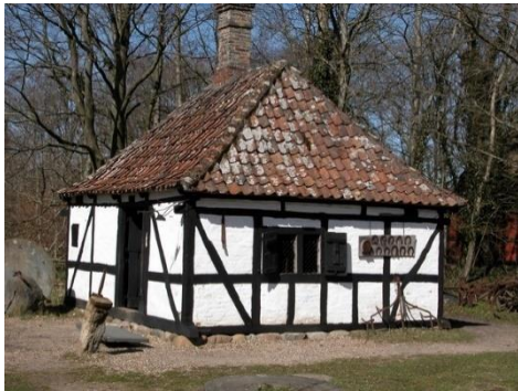
Smedjen kan have set sådan ud. (Den gl. smedje i Vester Kærby)