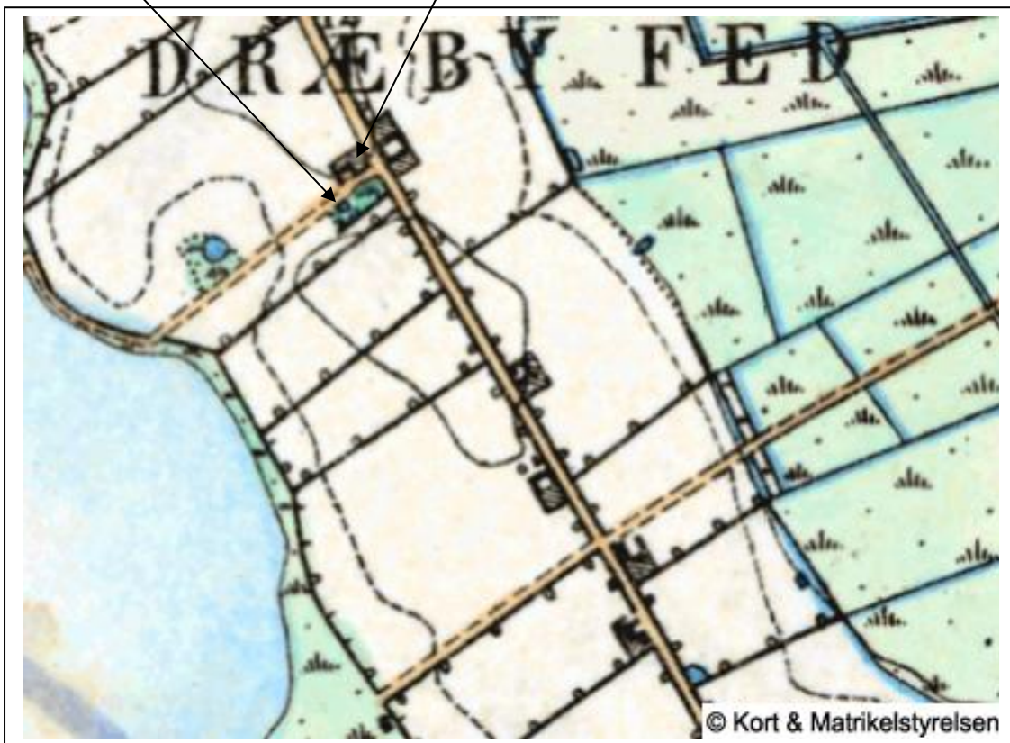
Udsnit af målebordsblad 1842-99 med Lillesøstedet og den lille sø markeret