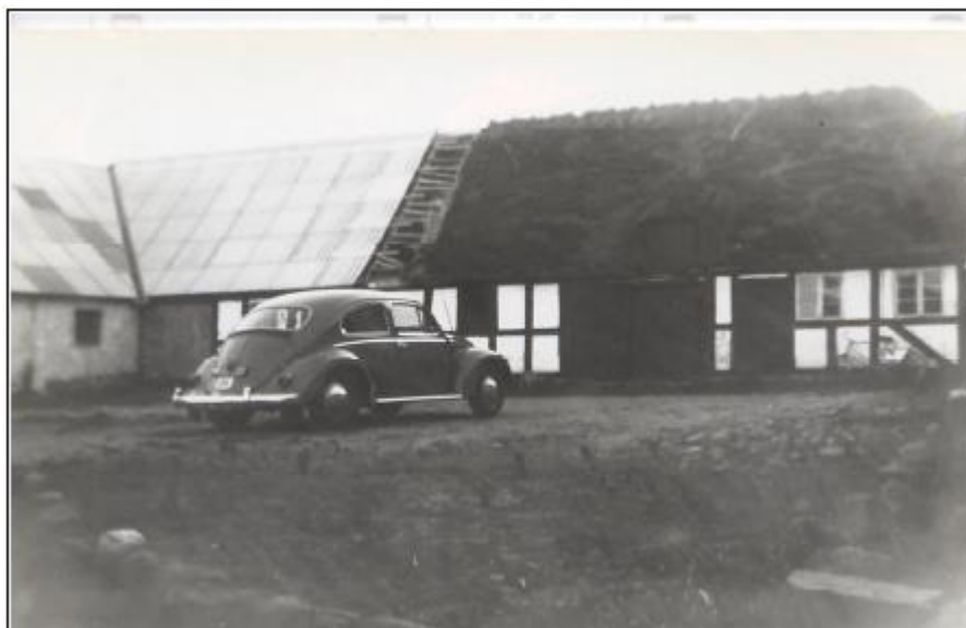
Bemærk især taglæggerne i åbningen mellem tagene

Køkkenet lå i en udbygning mod haven. Taget var utæt og blev hurtigt udskiftet med et fladt tag. Ved køkkenet var der en gammel muret bageovn. Den faldt dog sammen året efter, de var flyttet ind, der var et stort gammelt jernkomfur i køkkenet. Det gav også lidt varme til et værelse ved siden af, ellers var den eneste opvarmningsmulighed en kakkellovn i den store stue.