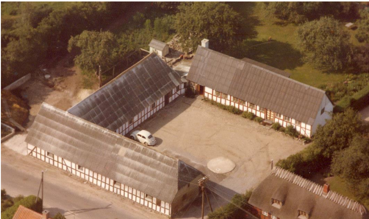
Vingården ca. 1976, der var oprindelig en vognport, hvor de to længer mødes.