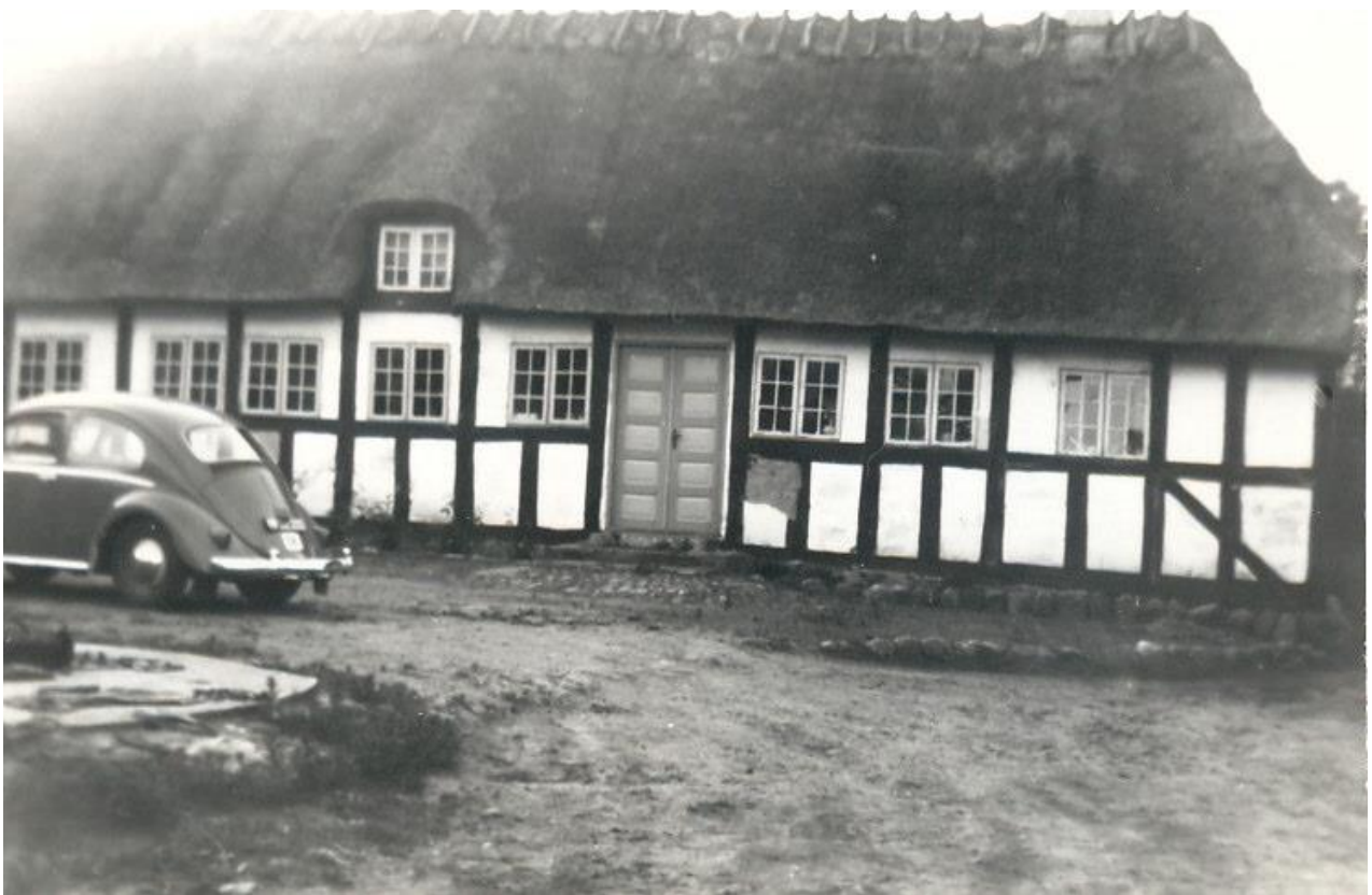
Stuehuset ved overtagelsen, kvisten er væk nu, i gavlen til højre var der et køkken, der tilhørte boligen, som lå til højre for hoveddøren.