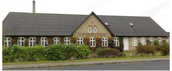
Fjordvej 10 - 2012

Bygningen husede fra 1900 til 1947 Munkebo-Drigstrup Andelsmejeri.