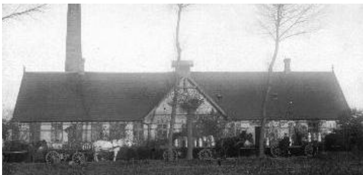
Mælkevognene linet op foran Munkebo Mejeri omkring 1910.